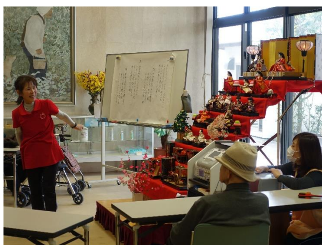
ひな祭り（ミュージック・ケア）