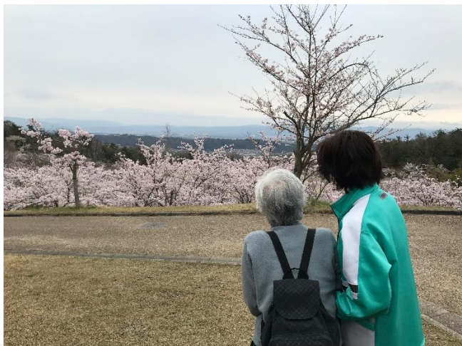
お花見（生駒山麓公園）