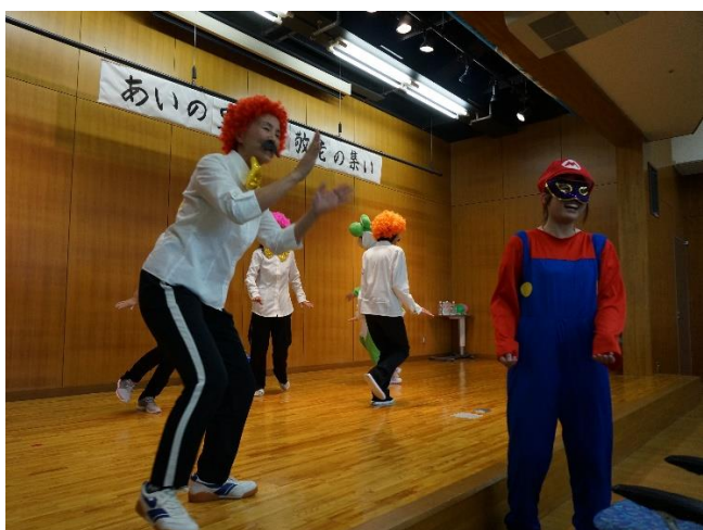
敬老の集い（ヒゲダンス）