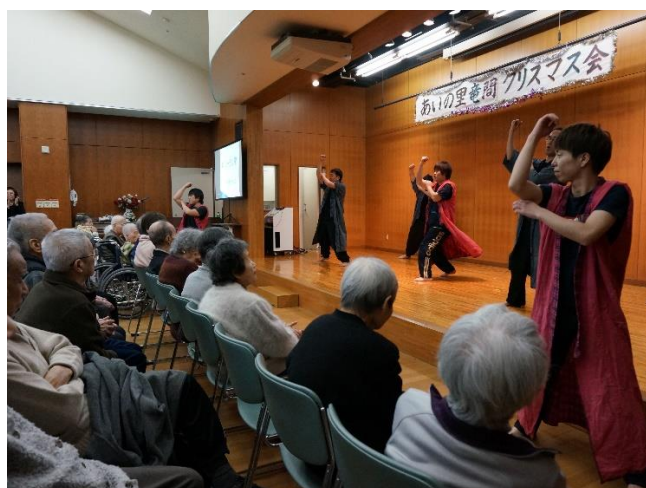
クリスマス会（ソーラン節）