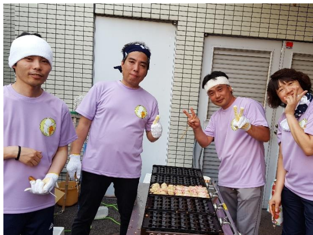
盆踊り大会（たこ焼き屋台）