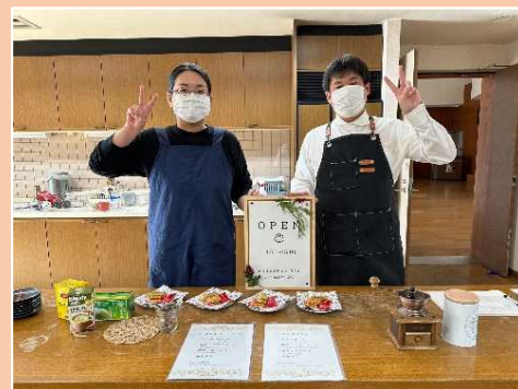
③ Café & Bar HAC

【①】10月22日（日）、ハロウィンパーティーを開催しました！ 仮装してコーヒーやお菓子を嗜みながら、トランプの神経衰弱や黒ひげ危機一発などのゲームを楽しんで盛りあがりました ^^