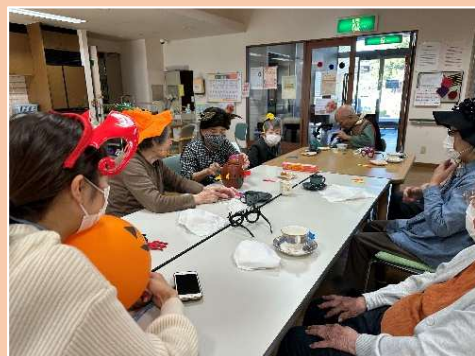
① ハロウィンパーティー