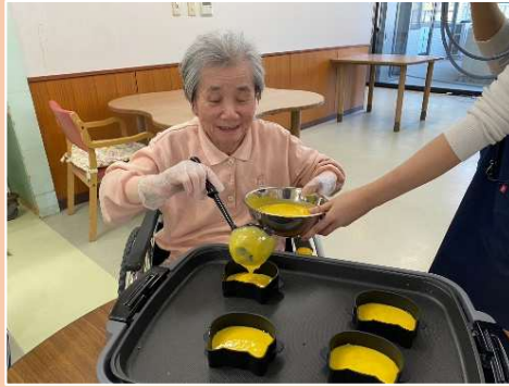
② ハロウィンおやつレク