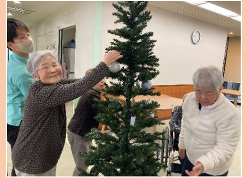
③ クリスマスツリー飾りつけ

【①】「いくつになっても綺麗でいたい」そんな入居者様の想いを叶えるために、特養では出張理容サービスの内容を充実化しています！ 美容院に行くような感覚でヘアカットを楽しんでいただければと思います♪