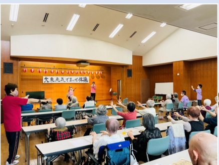
④ 元気でまっせ体操