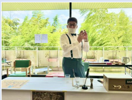
② Bar かつらぎ