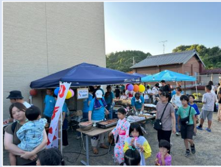
① たつま地域食堂（盆踊り）