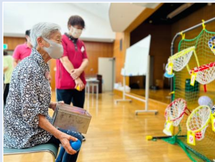
① 敬老レク（デイ&ケア）