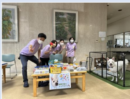
⑤ 駄菓子屋 & ドッグカフェ